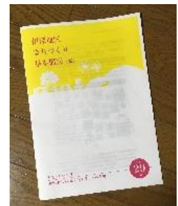
「伊深地区まちづくり 基本構想」